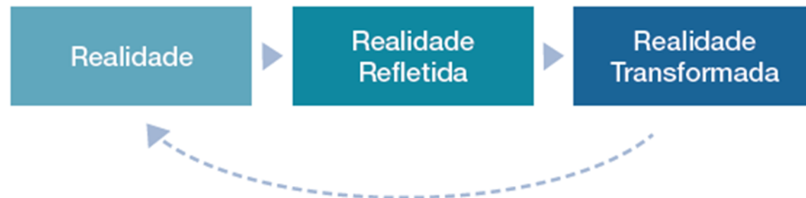
Figura 3 - Atividade Reflexão-ação